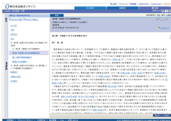
下巻の表示内容(サンプル)