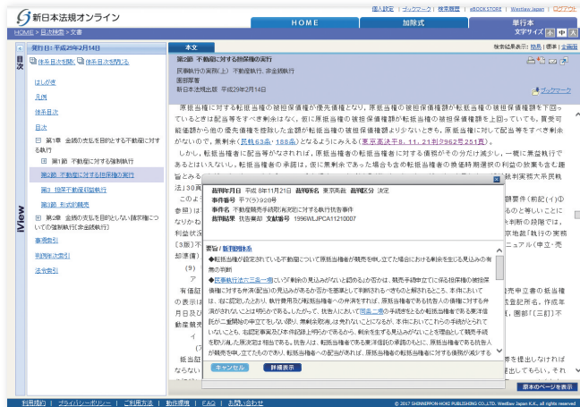
判例へのリンクが充実