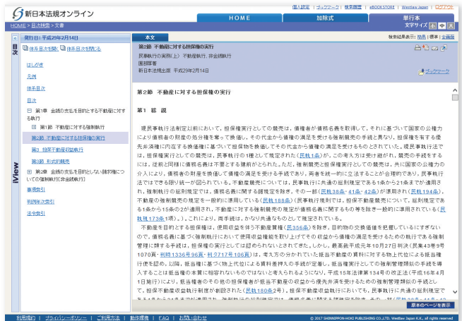
書籍をオンラインに再現

主な著書に、「(三訂版)不動産競売マニュアル(申立・売却準備編)・(売却・配当手続編)」、「民事執行手続・書式ハンドブック」、共著「問答式民事執行の実務」(加除式)、共著「債権執行手続の実務」(加除式)、共著「Q&A不動産競売の実務」(加除式)いずれも新日本法規出版、「書式不動産執行の実務(全訂10版)」、「書式債権・その他財産権・動産等執行の実務(全訂14版)」、「書式代替執行・間接強制・意思表示擬制の実務(第五版)」いずれも民事法研究会、共著「供託先例判例百選(第二版)」別冊ジュリスト158号等がある。