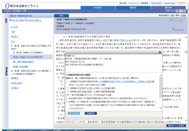
法令へのリンクを完備